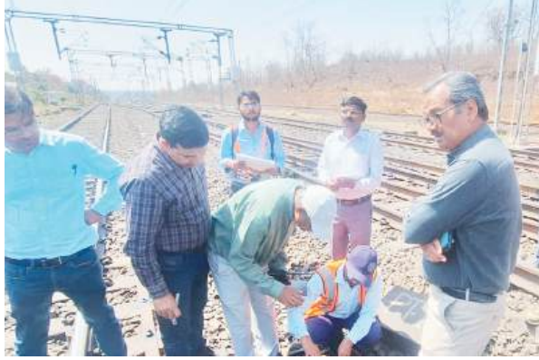
रेलवे के अधिकारियों ने लिया व्यवस्थाओं का जायजा

निरीक्षण का उद्देश्य रेल संचालन की सुरक्षा व्यवस्था को सुदृढ़ करना और यात्री सुविधाओं की गुणवत्ता का आकलन करना रहा। डीआरएम ने ट्रेक, सिग्नलिंग सिस्टम, पुल-पुलियों, रेलवे क्रासिंग सहित अन्य महत्वपूर्ण संरचनाओं का बारीकी से निरीक्षण किया। उन्होंने अधिकारियों को निर्देश दिए कि सभी संरक्षण मानकों का कड़ाई से पालन सुनिश्चित किया जाए और किसी भी प्रकार की लापरवाही पर सख्त कार्रवाई की जाए।