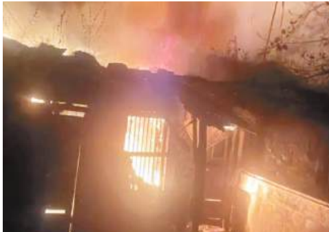
इस तरह लगी खाली भूखंड में आग

शहर के व्यस्ततम क्षेत्र भारत टॉकीज के सामने स्थित बसाहट वाले मार्ग पर शुक्रवार की रात उस वक्त अफरा-तफरी मच गई, जब एक खाली भूखंड में बने छप्पर में अचानक आग लग गई। घटना रात लगभग 11:15 बजे की है। घनी आबादी वाला क्षेत्र होने के कारण आग की लपटें देख आसपास के रहवासियों में हड़कंप मच गया। बताया जा रहा है कि उक्त खाली भूखंड पर पिछले कुछ समय से कुछ मजदूरों ने अपना छप्पर डाल रखा था और वहीं निवास कर रहे थे। शुक्रवार रात अचानक छप्पर से आग की लपटें उठने लगीं। गनीमत रही कि जैसे ही आग भड़की, तत्काल इसकी सूचना नगर पालिका और पुलिस को दी गई। सूचना मिलते ही डायल 112 की टीम और नगर पालिका की दमकल मौके पर पहुंच गई। संकरी गली और आसपास रिहायशी इलाका होने के कारण खतरा काफी बड़ा था, लेकिन दमकल कर्मियों ने कड़ी मशक्कत के बाद आग पर पूरी तरह काबू पा लिया। प्रत्यक्षदर्शियों के अनुसार, यदि आग पर काबू पाने में थोड़ी भी देरी होती, तो आसपास के मकानों तक आग पहुंच सकती थी, जिससे बड़ी जनहानि या आर्थिक नुकसान हो सकता था।